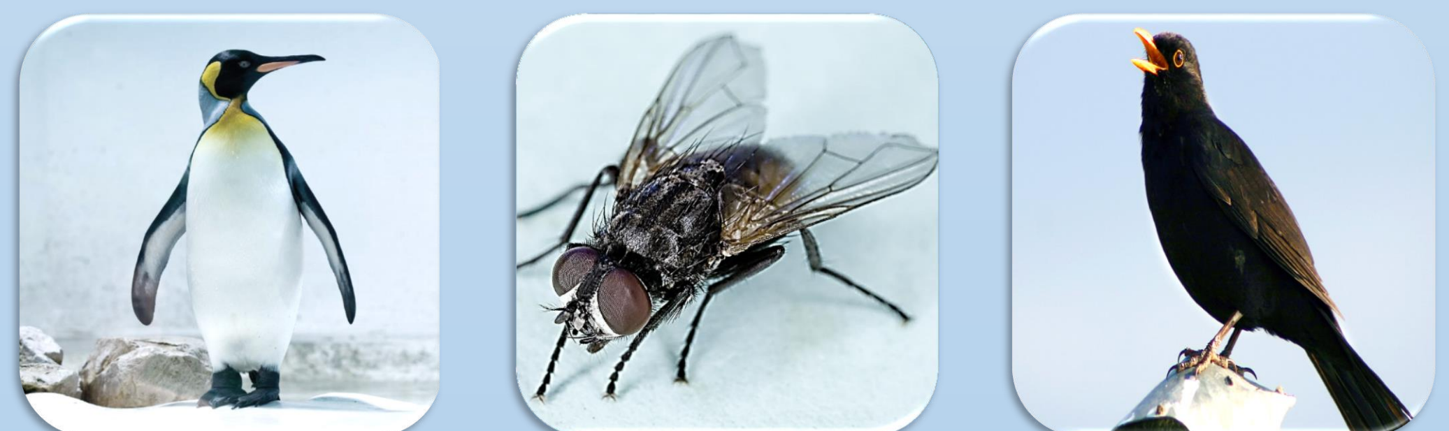
Figuur 3: voorbeeld van een oefening voor het semantisch systeem via de auditieve input route met aandacht voor het complexiteits-effect.